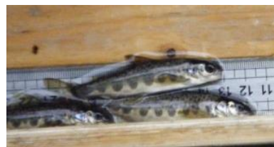
Jeunes saumons atlantiques

Le label « Natura 2000 » a été accordée sur le bassin de la Soulevre du fait de la présence de cinq espèces aquatiques, rares et fragiles, à l'échelle européenne : L'Ecrevisse à pattes blanches, le Chabot, la Lamproie de Planer, le Saumon atlantique et la Loutre d'Europe.